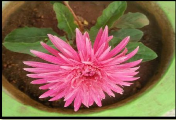
Pugalarasan S, III Metallurgy