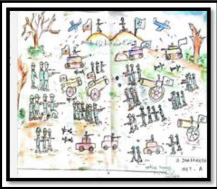
Dharanesh S - I Metallurgy